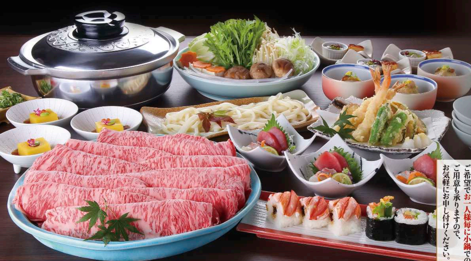
※写真はロース肉プラン3人前 ※写真はイメージです

ご希望で一人様毎に小鍋での ご用意も承りますので、 お気軽にお申し付けください。