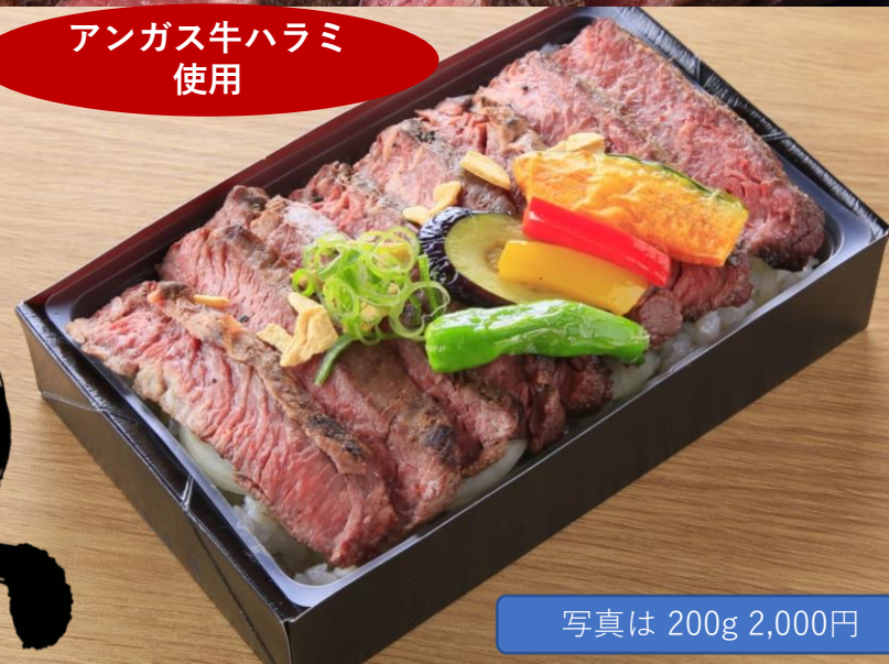
写真は 200g 2,000円