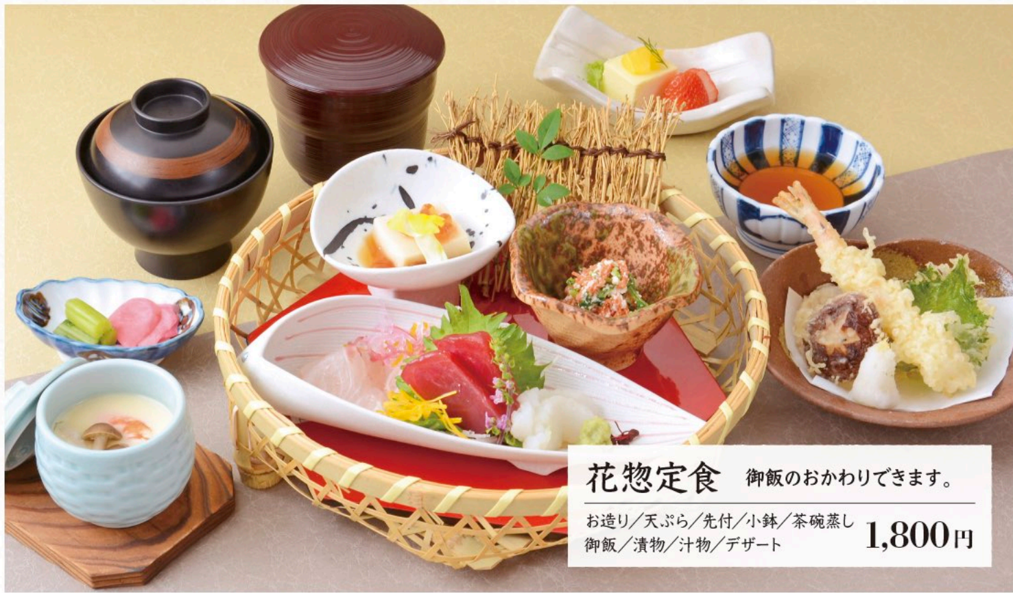
花惣定食 御飯のおかわりできます。 お造り/天ぷら/先付/小鉢/茶碗蒸し 御飯/漬物/汁物/デザート 1,800円