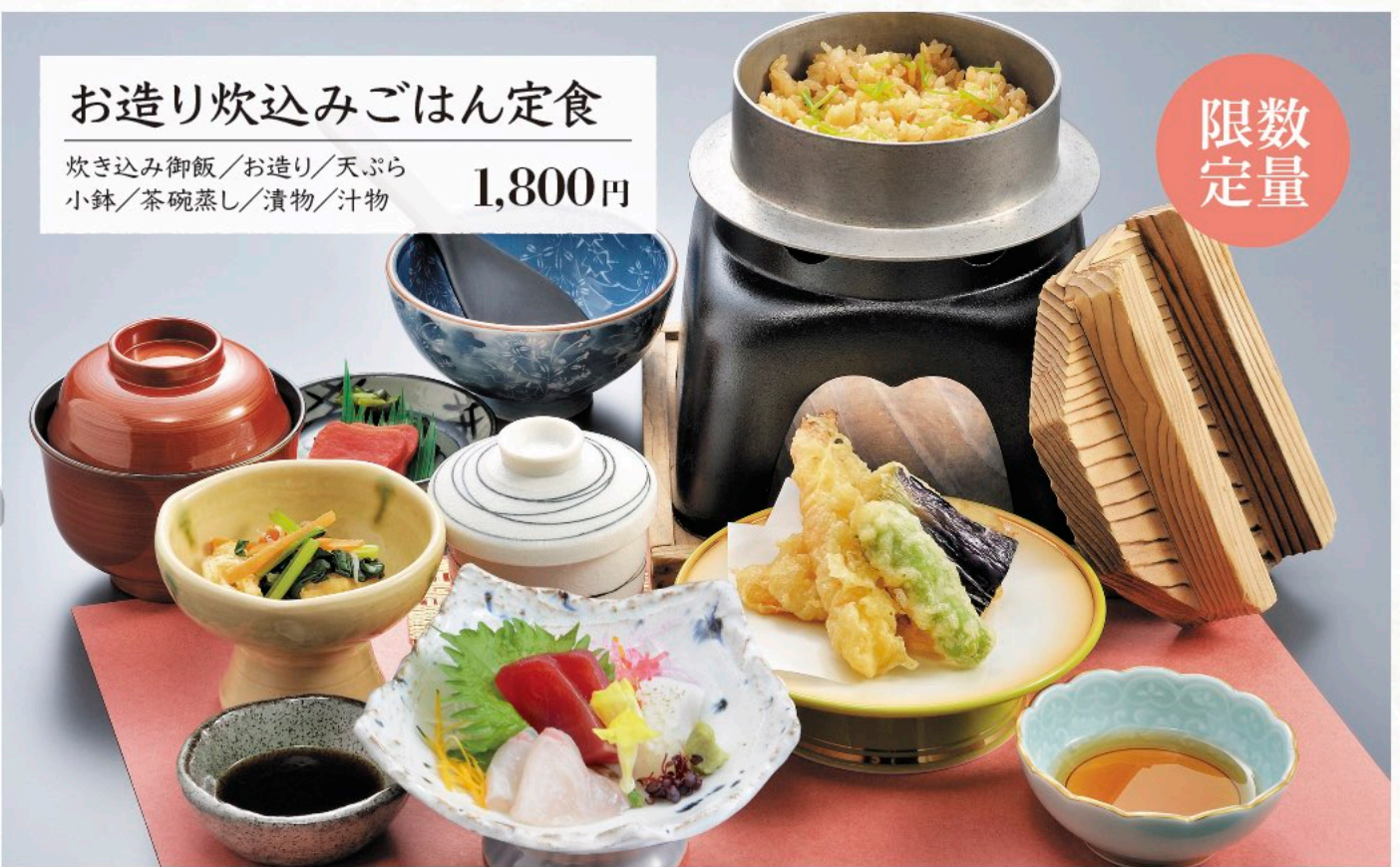
お造り炊込みごはん定食 炊き込み御飯/お造り/天ぷら 小鉢/茶碗蒸し/漬物/汁物 1,800円