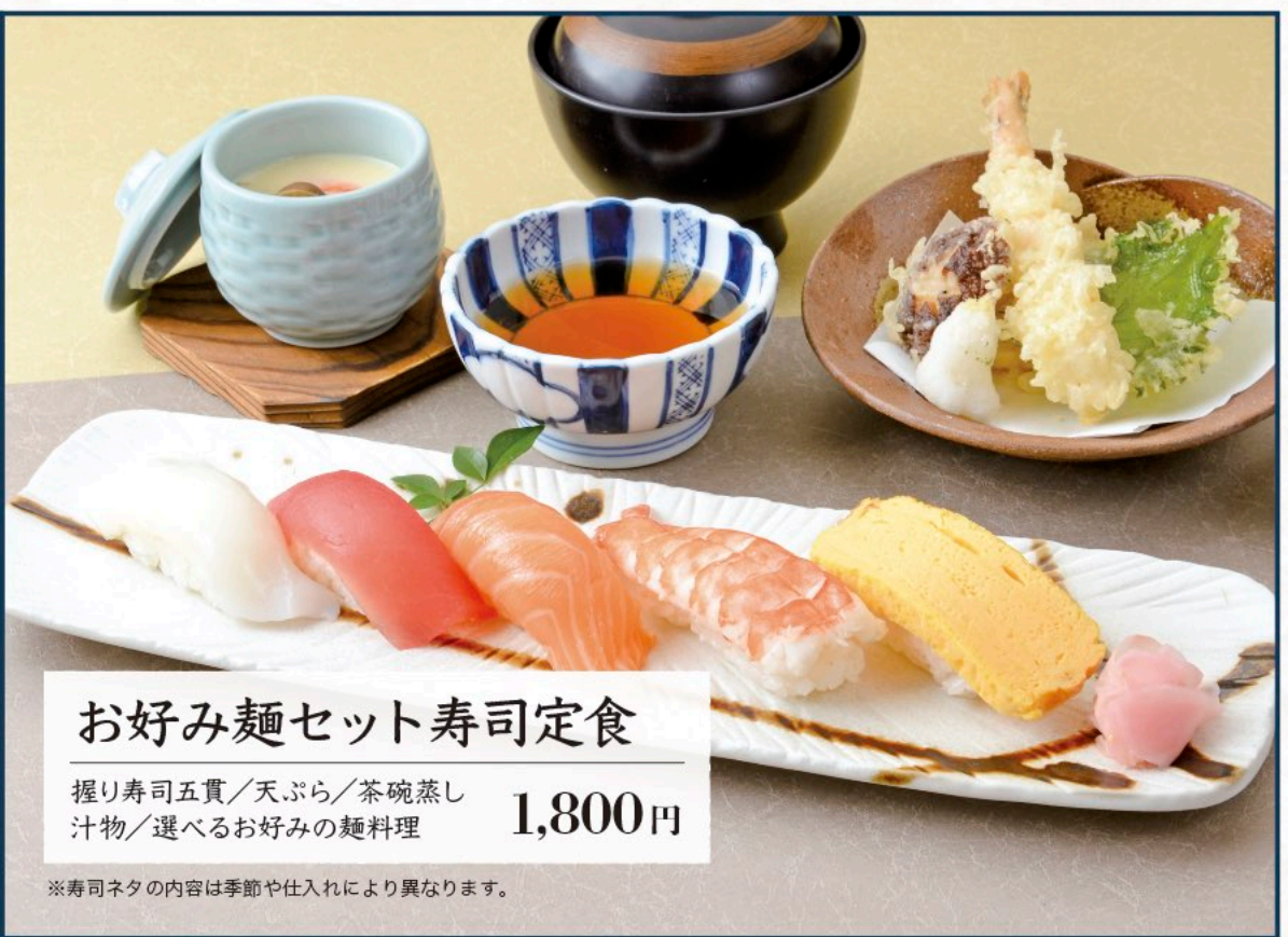
お好み麺セット寿司定食 握り寿司五貫/天ぷら/茶碗蒸し 汁物/選べるお好みの麺料理 1,800円